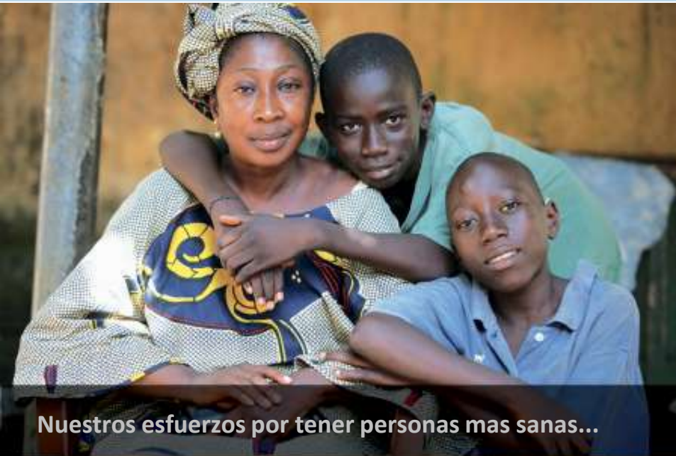
Nuestros esfuerzos por tener personas mas sanas...