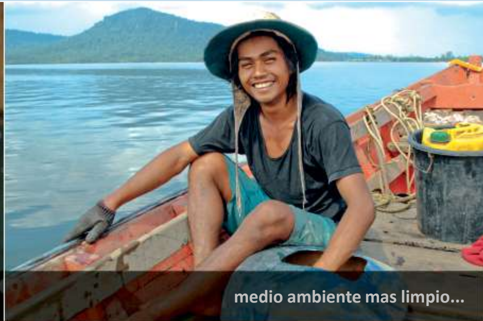
medio ambiente mas limpio...