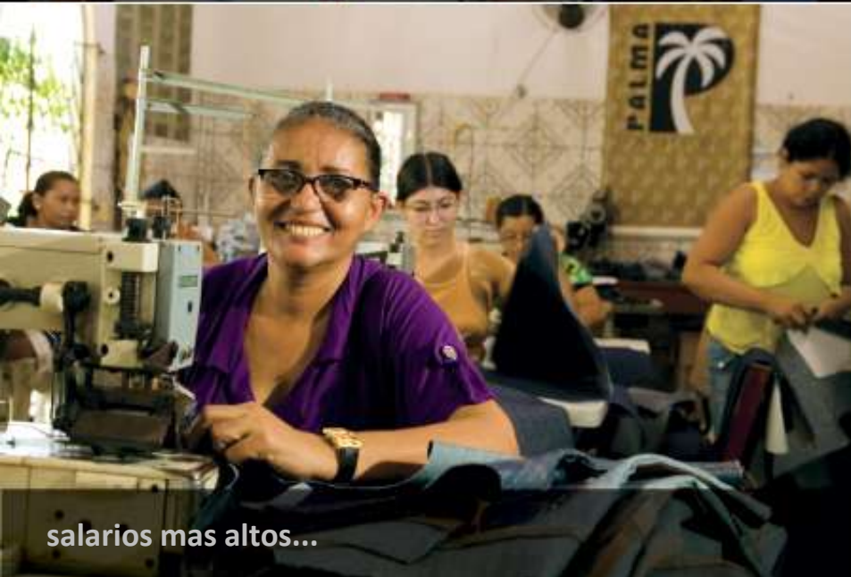
salarios mas altos...